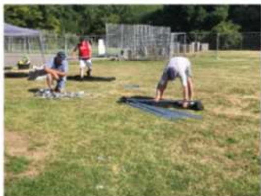
Ieder jaar weer een opgAAF: de slaaptent opbouwen. Uiteindelijk komt het goed.

Ieder jaar is het weer verbazingwekkend om te zien hoe in enkele dagen vanaf niets, behalve het aanwezige gras, een compleet JOL-dorp ontstaat. En dat in een buitentemperatuur van meer dan 30° Celcius. Rondom ons terrein een veilige omheining (zowel voor de kinderen als voor ons). Een ruime slaaptent met daarbij gezellige partytenten voorzien van ledverlichting. Vanuit de gymzaal komen elektra- en wateraansluitingen richting onze kookwagen. Extra elektriciteit komt van onze vriendelijke overbuurman Jan. Zie hier hoe dat in z'n werk gaat.