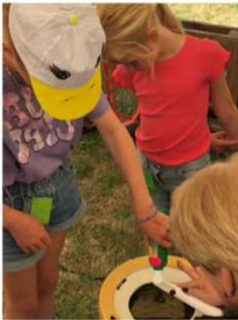
We vervolgen ons programma met het maken van een persoonlijk werkstuk met plakkaatverf in een oude centrifuge. Papier even laten drogen aan een waslijntje en klaar om mee naar huis te nemen.