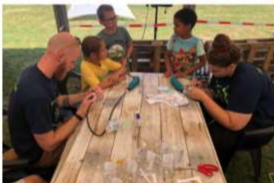
De laatste kinderen voltooien het graveren van hun glas. En tot slot krijgen alle kinderen (en een aantal ouders en alle leiding) heerlijke ijsjes.